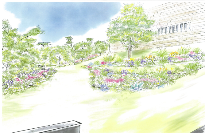
▲「海に見える庭」完成イメージ図

MOA美術館（静岡県熱海市）は、館内ムアスクエア・エリアにて整備を進めてまいりました「海に見える庭」の第一期工事が完成し、令和8年5月29日（金）にグランドオープンを迎えます。