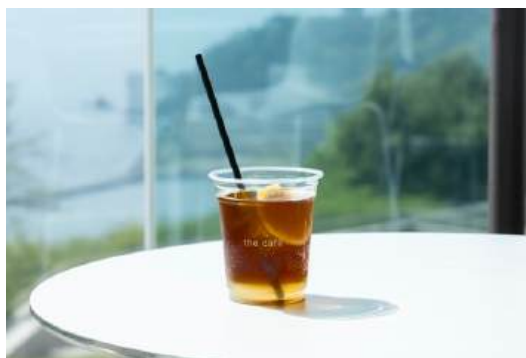
⑧黄金柑コールドブリューソーダ