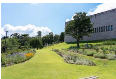
①ナチュラルガーデン