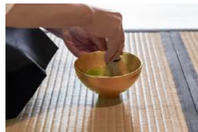
⑥抹茶体験イメージ