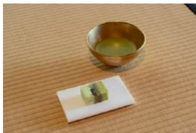
⑤黄金の茶碗・お菓子