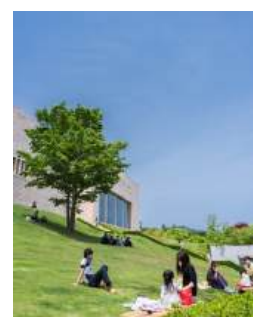
③ピクニックイメージ