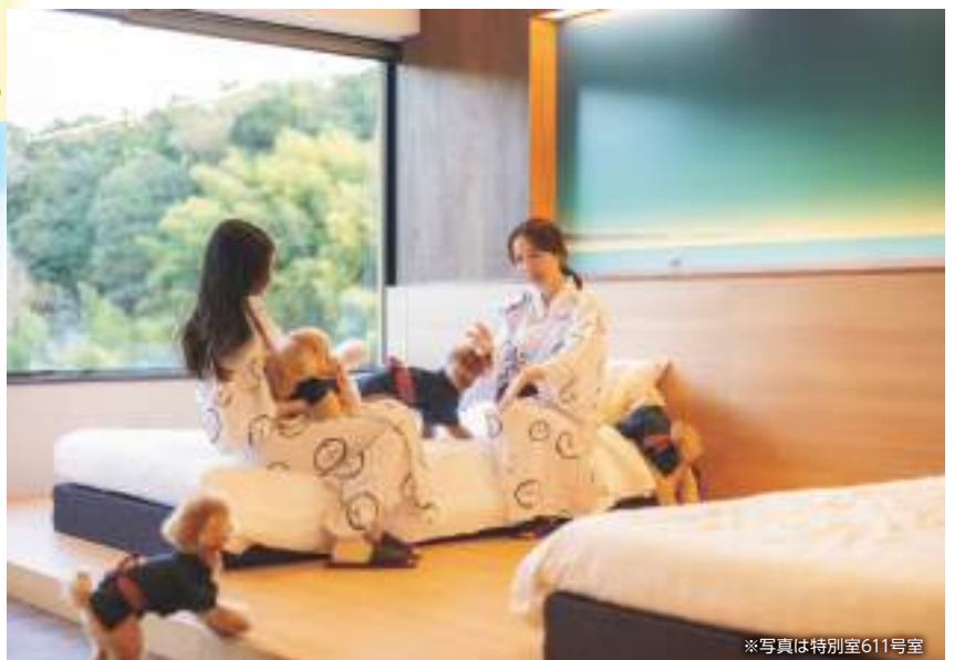
※写真は特別室611号室

ペット専用の足湯や室内インテリアなど、ペットも飼い主も安心のおもてなしが満載。一部の客室はペットとベッドで寝たり部屋食が可能で、滞在中ずっと一緒に過ごすことができる。温泉気分が盛り上がる、ペット用作業衣も用意。