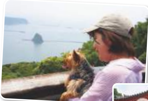
[絶景]のDOG RUN わんView広場