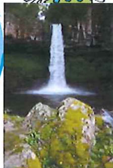
ハート岩は人気撮影スポット