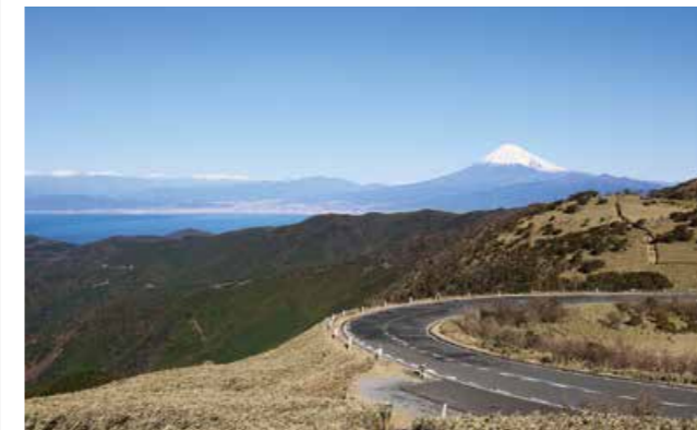
富士山とワインディングロード