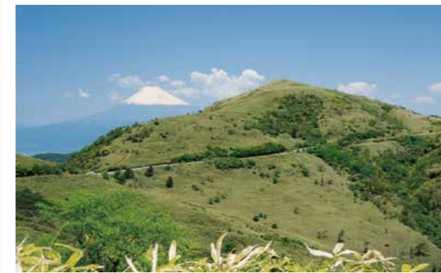
西伊豆の尾根伝いと富士山