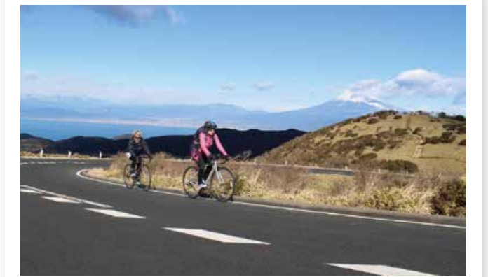
達磨山付近のカーブと富士山