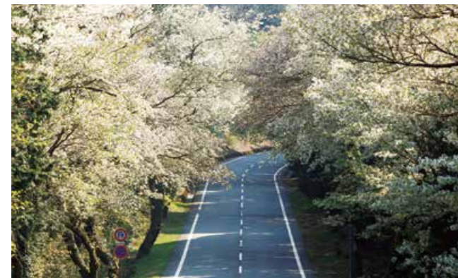
桜並木 (冷川IC~天城高原IC)