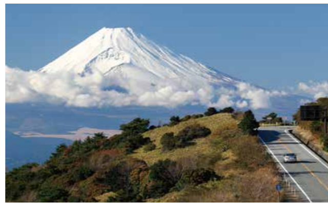
玄岳IC付近と富士山