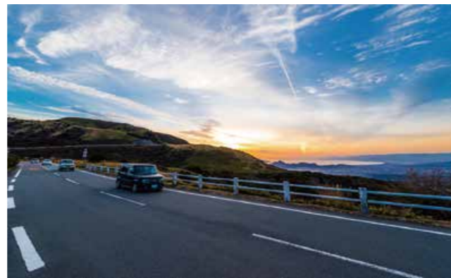
夕焼けと絶景のコース