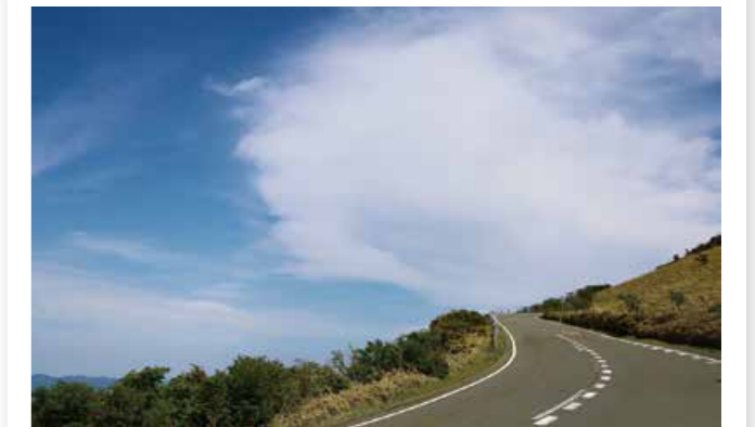
達磨山付近のカーブ