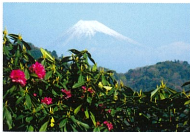
展望台からの富士山

また展望台からは天城の山々と富士山が望めます。園内は全長約2kmの遊歩道になります。